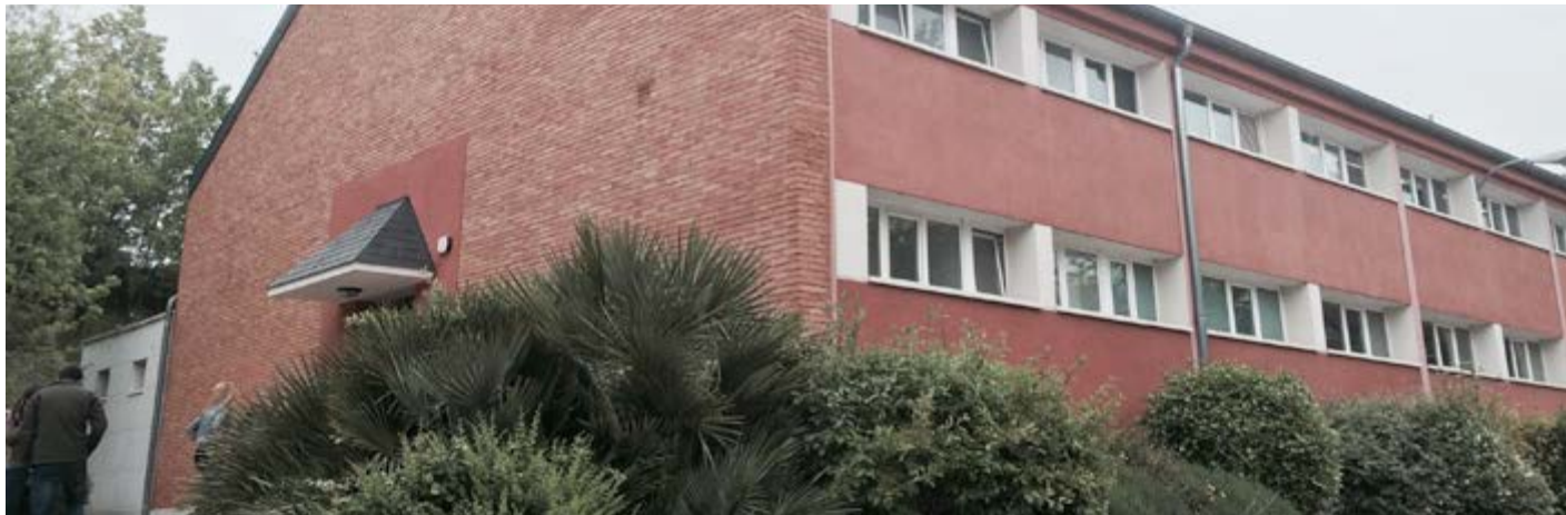
La entrada principal de la biblioteca de la antigua ETSI Montes el pasado martes