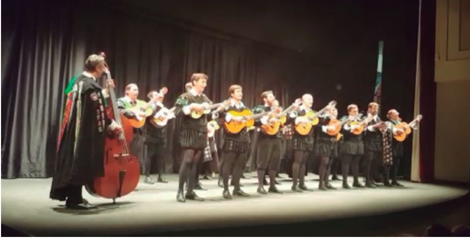
La Tuna de Montes actuando en el centro “Carmen Conde” de Majadahonda, Madrid.

Los chavales, todos en su primer año, destacaron con una soltura inusual y conquistaron el primer premio en el VII Certamen de Tunas organizado por el Ayuntamiento de la ciudad, en el que participaron también otras asociaciones como las de Industriales, Caminos y Ciencias.