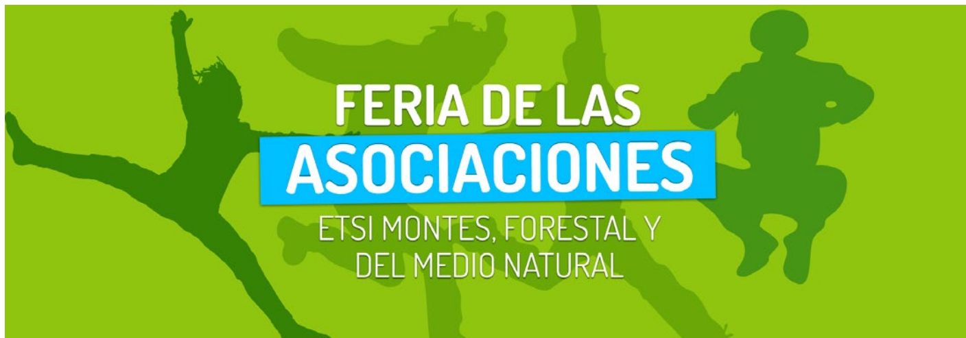
Cartel de la "I Feria de las Asociaciones"