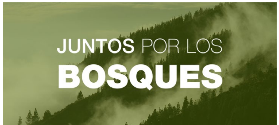
Imagen oficial de la iniciativa “Juntos por los Bosques”

La Delegación de Alumnos de la ETSI Montes, Forestal y del Medio Natural de la Universidad Politécnica de Madrid se ha adherido a la iniciativa “Juntos por los Bosques”, una propuesta que reúne a más de 25 entidades del sector forestal español.