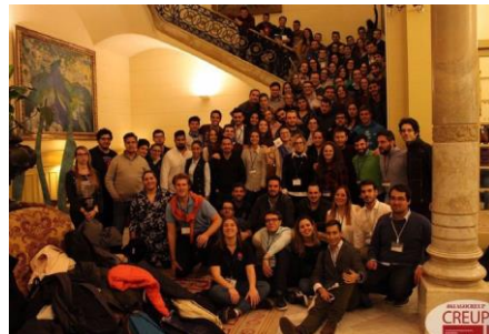
MÁXIMOS ÓRGANOS DE REPRESENTACIÓN ESTUDIANTIL EN LA #61AGOCREUP

La asamblea, con una asistencia de aproximadamente cien personas, comenzó su primer día con unas jornadas de bienvenida en la Universidad de las Islas Baleares. Disfrutamos de una inauguración con la visita de la Presidenta de la Comunidad, la Vicerrectora Estudiantil y el Vicepresidente del Parlament.