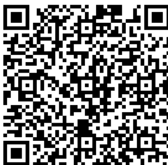
Código QR de la encuesta ( https://goo.gl/w3DF4i )

medias verdades que solemos tener asumidas y que más a menudo de lo que somos conscientes tomamos por ciertas. Me surgió entonces una nueva pregunta a la que no podía responder: ¿soy un caso aislado, o esto nos pasa a todos en mayor o menor medida?, y de ser así, ¿existe alguna manera de “probarlo y comprobarlo”?