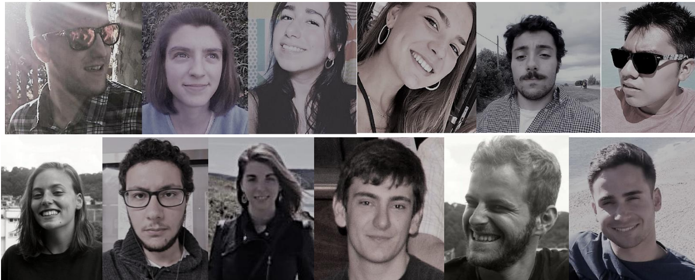
DELEGADO Y SUBDELEGADOS DE LA DELEGACIÓN DE ALUMNOS ETSIMFMN Y MIEMBROS DE ALGUNAS SUBDELEGACIONES