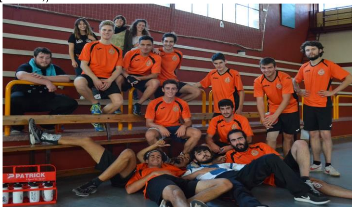
EQUIPO DE BALONMANO EN EL PARTIDO CONTRA AGRÓNOMOS

Y recordad, ¡La lluvia no es excusa para no hacer deporte! ;)